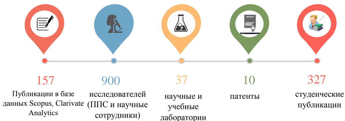
Рисунок 3 – Научные достижения Университета Ахмета Ясави (в цифрах)

Научно-инновационная деятельность Университета Ахмета Ясави основана на дальнейшей интеграции образования, науки и инноваций. Ученые университета интересуются тюркологией, археологией, религией, историей, экономикой, математикой, физикой, информационными технологиями, экологией, электроэнергетикой, биотехнологиями, медициной и т.д. проводит исследования в полевых условиях. Научный портфель университета представлен на рисунке 3.